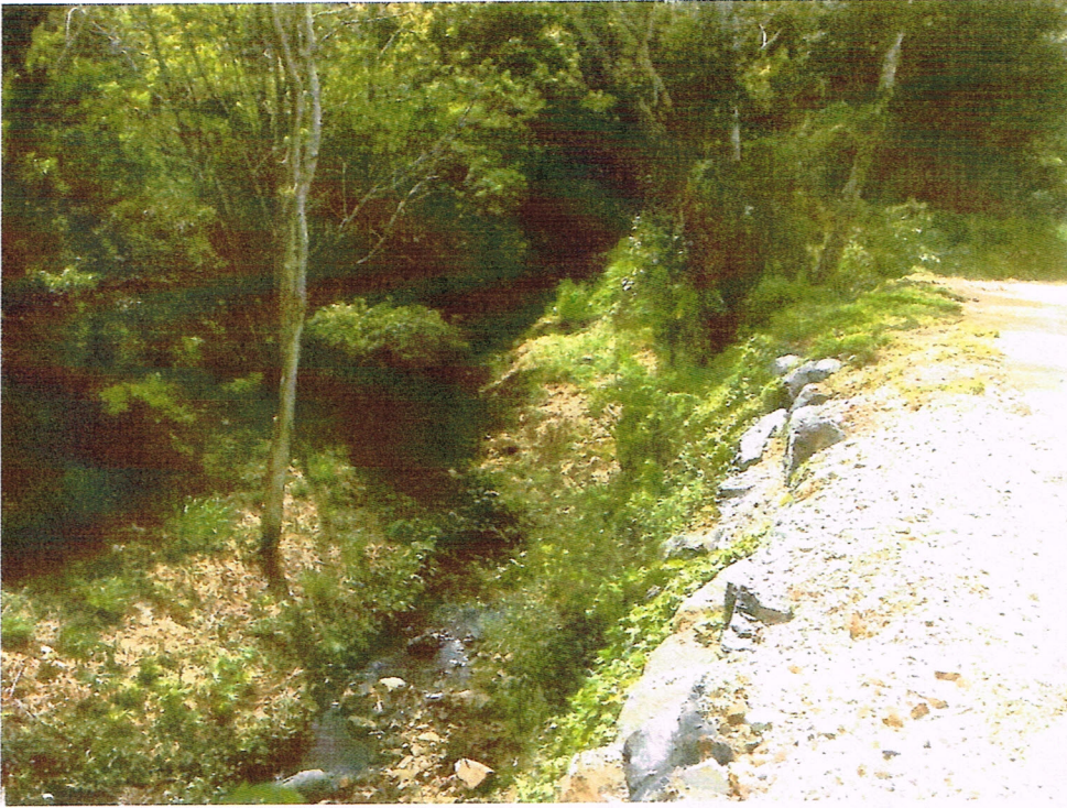
Crick à 80 mètres du dépôt de gravats.