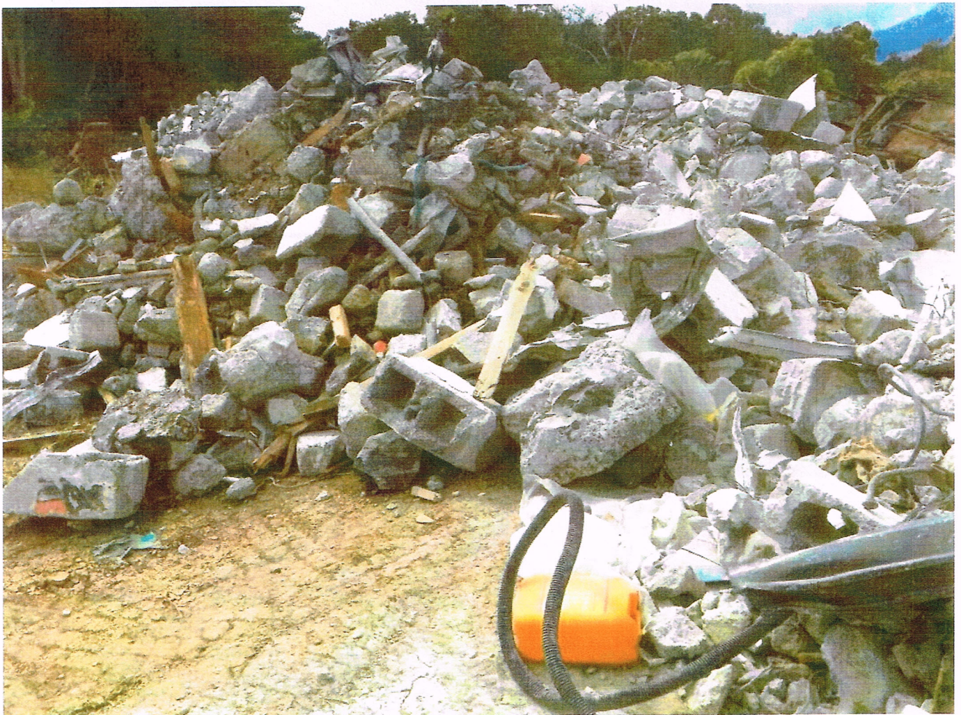
Bois, ferrailles, tôles, plastiques sont mélangés au tas de gravats