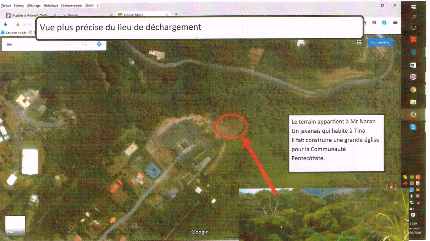
Vue plus précise du lieu de déchargement